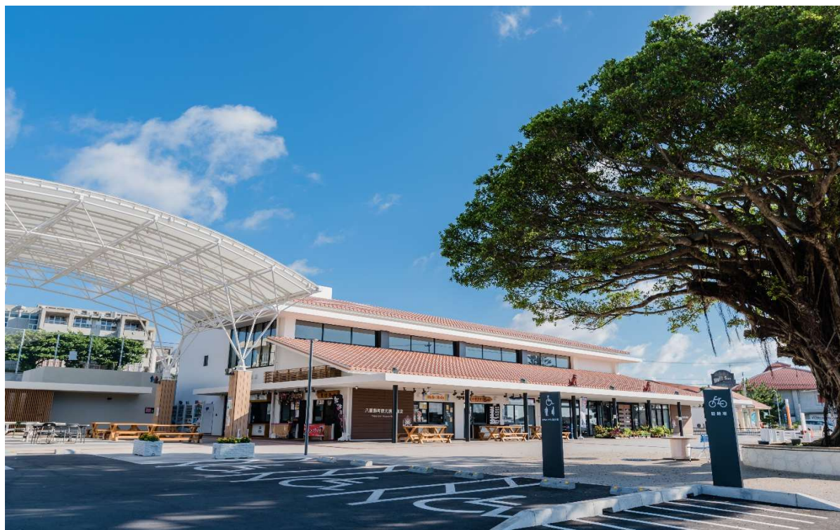
八重瀬町観光拠点施設 南の駅やえせ 外観写真