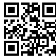
八重瀬町観光物産協会 instagram